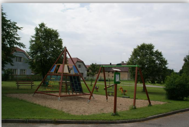
Dětské hřiště v obci